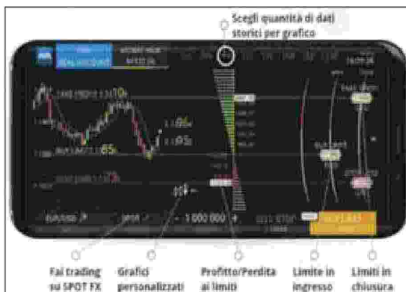
La piattaforma AvaOptions per mobile consente di gestire il rischio direttamente dai grafici